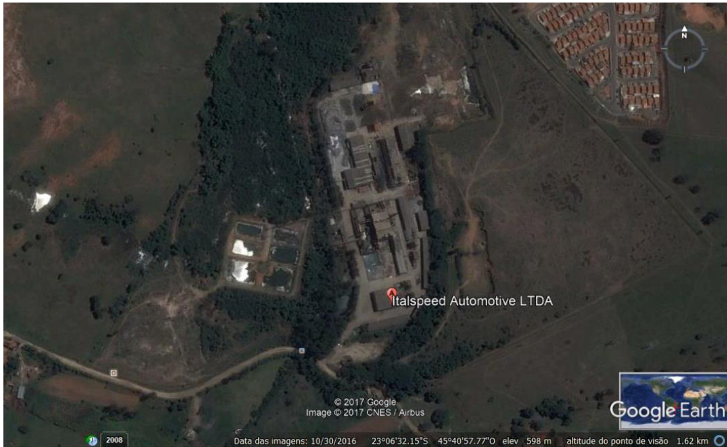
FIGURA 3 – IMAGEM DA FABRICA VIA SATÉLITE