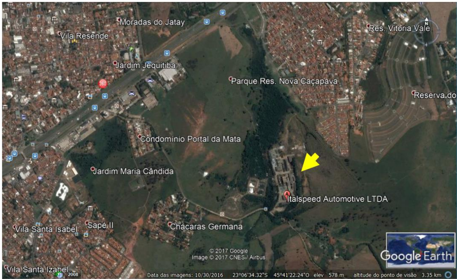
FIGURA 2 – SITUAÇÃO GEOGRÁFICA DO TERRENO