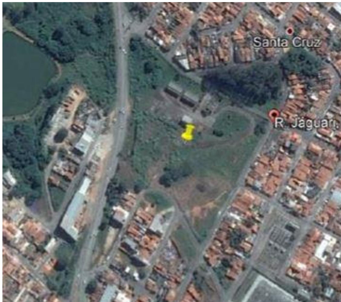
Detalhe da posição do imóvel