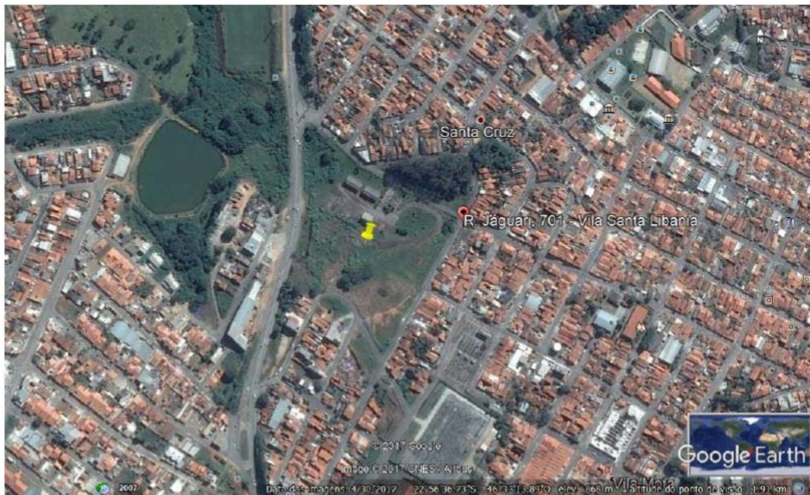
FIGURA 3 – POSIÇÃO DO IMÓVEL